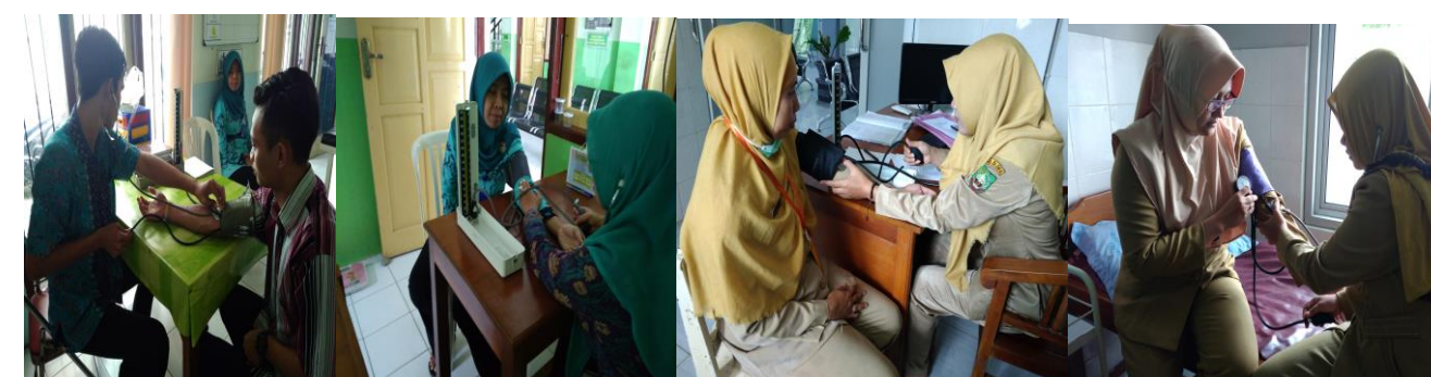
Tabel 5. Hasil Pengukuran Alat-Alat Tensimeter Puskesmas Blora