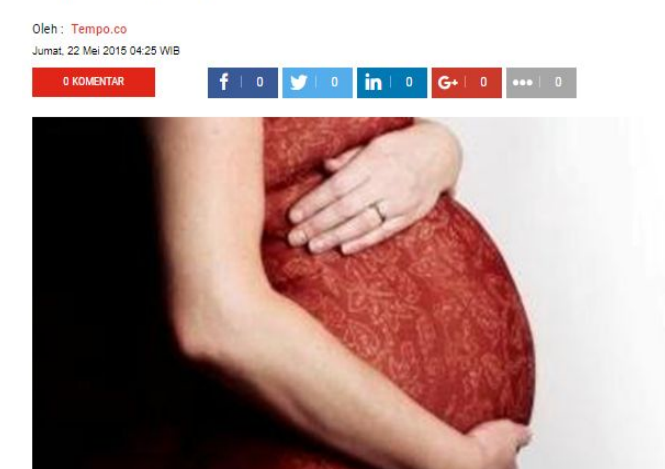
Dari 10.000 Pernikahan di Lumajang, Seperempatnya Menikah Dini