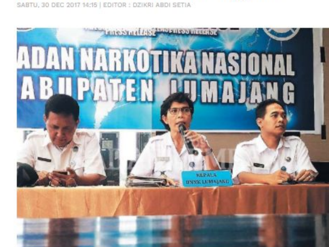
Setahun Rehabilitasi 57 Pengguna

TEMPO.CO, Lumajang - Kasus pesta minuman keras pelajar di ruang kelas di sebuah sekolah menggegerkan dunia pendidikan Kabupaten Lumajang, Jawa Timur. Sebanyak 14 pelajar yang disangka sebagai peserta pesta tersebut langsung disodorkan ke Badan Narkotika Nasional Kabupaten Lumajang untuk direhabilitasi.