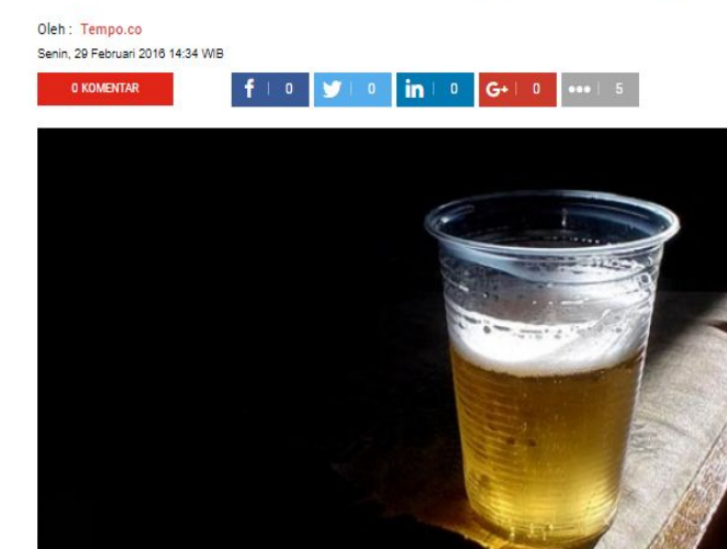
Pelajar Pesta Miras di Kelas Gegerkan Lumajang

TEMPO.CO, Lumajang - Kasus pesta minuman keras pelajar di ruang kelas di sebuah sekolah menggegerkan dunia pendidikan Kabupaten Lumajang, Jawa Timur. Sebanyak 14 pelajar yang disangka sebagai peserta pesta tersebut langsung disodorkan ke Badan Narkotika Nasional Kabupaten Lumajang untuk direhabilitasi.