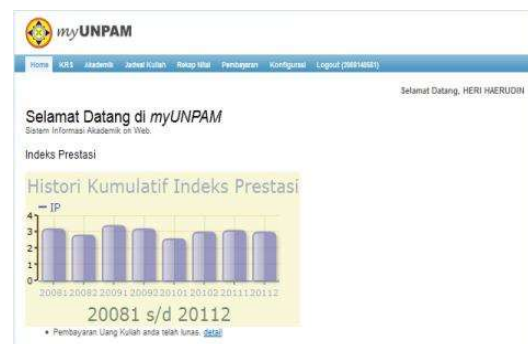
Gambar 2. Halaman Utama www.myunpam.ac.id

Pada portal www.my.unpam.ac.id mahasiswa bisa mengakses atau mendapatkan informasi tentang nilai, KRS, pembayaran, jadwal mata kuliah dan pengumuman terbaru tentang kegiatan perkuliahan.