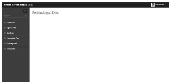
Gambar 4.1 Home