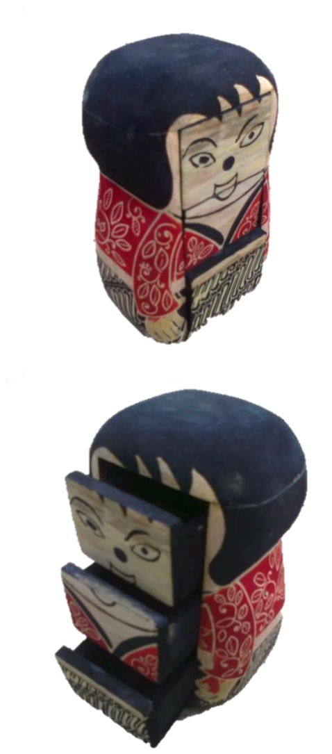
Gambar 6. Batik kayu boneka multi fungsi desain 2

Batik kayu mengandung unsur seni yang padat, karena merupakan penggabungan antara seni kerajinan kayu dan seni batik. Pengorganisasian elemen-elemen seni berupa garis, bentuk, bidang, warna, dan tekstur dalam suatu komposisi harmonis (Sanyoto, 2010), berupa motif batik pada kerajinan kayu. Desain produk ini merupakan upaya memberi dekorasi pada kayu polos menjadi kayu bermotif batik. Adanya pemberian motif hias batikan ini, meningkatkan rasa ketertarikan konsumen pada produk batik kayu multifungsi tersebut.