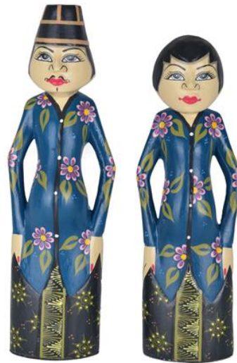
Gambar 1. Boneka menong teknik pahat

dikerjakan dengan teknik bubut dapat dilihat dalam Gambar 2. Keunikan dan filosofi boneka tersebut memiliki daya tarik untuk dijadikan sumber inspirasi penciptaan desain produk pengembangan batik kayu.