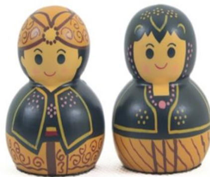
Gambar 2. Boneka menong teknik bubut