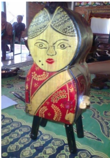
Gambar 5. Batik kayu boneka multi fungsi desain 1

Produk kerajinan kayu atau mentahan yang telah dihaluskan dan dibersihkan dari sisa debu dapat segera diberi motif batik dengan pensil, selanjutnya dilakukan pematikan seperti membatik pada media mori. Pematikan ini meliputi penorehan lilin panas dengan canting, pemberian warna, serta pembersihan lilin/pelordan. Setelah melalui proses panjang tersebut maka terwujudlah motif batik yang indah di atas permukaan kayu yaitu batik kayu. Untuk mengetahui kualitas kekuatan warna yang melekat pada kayu, dilakukan uji ketahanan luntur warna terhadap gosok dan cahaya tengah hari.