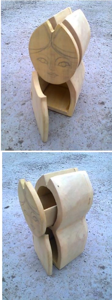
Gambar 4. Bahan kerajinan kayu mentahan desain 1

kerja. Gambar kerja ditempelkan pada bahan kayu untuk dikerjakan menjadi produk kerajinan kayu.