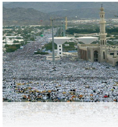
Image 1. Crowds at the Hajj

Problem kesehatan utama yang dihadapi jamaah haji secara umum terdiri dari Communicable Diseases dan Non Communicable Diseases. Penyakit saluran nafas sebagai CDs tertinggi (73,3%). Heat stroke/attack, Sunlight effects sebagai tertinggi NCDs (16,67%). Tragedi terinjak menjadi salah satu sebab kematian dengan kecenderungan naik turun. Penyakit kardiovaskuler menjadi penyebab 46-66 % kematian jamaah.. Diperlukan perubahan mindset bahwa persyaratan kemampuan kesehatan harus diterapkan dengan melakukan skrining, treatment dan penilaian kemampuan fisik sebelum keberangkatan.