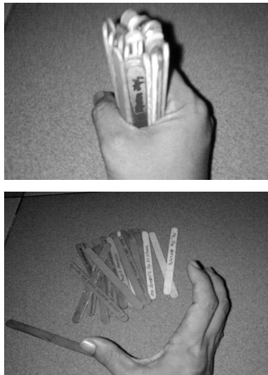
Gambar Step 4

Step 4 : Di atas meja, tutor menggenggam semua batang es krim (28 buah), lalu melepaskannya.