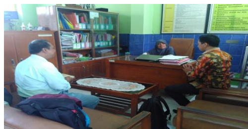
Gambar 1. Wawancara terhadap kepala sekolah dan guru kelas

pendamping dalam proses pembelajaran di kelas.