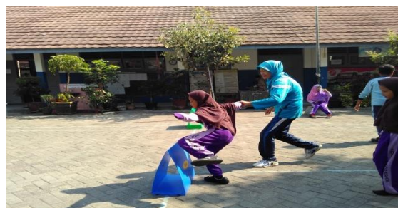
Gambar 2. Kegiatan Pembelajaran Penjas Adaptif

Sementara hasil observasi pada pembelajaran penjas ditemukan data sebagai berikut: