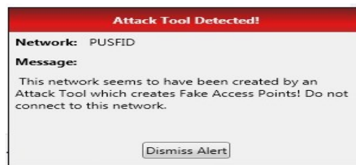
Gambar 4. Notifikasi Chellam

Scanning dilakukan dalam jangkauan 100 m dari lokasi publik area. Hasil scanning ditemukan pada beberapa AP yang sedang aktif antara lain yaitu, FTIUII, Pascasarjana, INFDOSEN, FTI UIINET dan PUSFI. Hasil pada proses scanning pada area tersebut ditemukan adanya ancaman AP palsu dengan SSID “PUSFID”. Sesuai yang ditunjukkan pada Gambar 4.