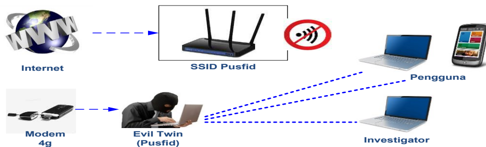
Gambar 2. Skenario MITM Based Evil twin

Pada skenario ini pelaku akan menggunakan AP palsu untuk menjerat para korban dan setelah korban terhubung ke dalam AP palsu yang dibuat dengan sengaja. Dengan demikian pelaku akan dengan mudah melakukan serangan MITM untuk mendapatkan informasi rahasia yang dimiliki korban. Dapat dilihat pada Gambar 2 Skenario MITM Based Evil twin .