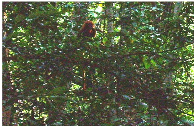
Gambar 2. Kelasi sedang makan daun/pucuk Jambu-jambu ( Syzygium cerinum )