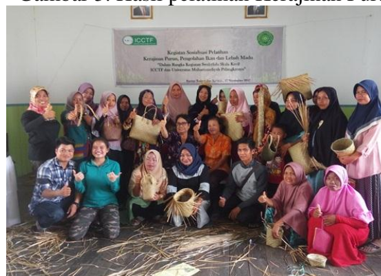
Gambar 3. Hasil pelatihan Kerajinan Purun

Keseriusan masyarakat dalam mengikuti kegiatan ini sangat dirasakan dengan banyaknya anggota masyarakat yang berminat mengikuti pelatihan ini. Dalam pelatihan ini mereka dituntut kreativitasnya dalam menciptakan produk yang paling kreatif dan unik langsung dapat hadiah dari penyelenggara latihan. Apabila masyarakat kawasan hutan kreatif dan inovatif dalam menciptakan berbagai produk berbahan hasil hutan bukan kayu yang potensial dari hutan tersebut, dijamin hutan akan selalu dijaga karena hutan merupakan sumber penghidupan masyarakat. Anggapan positif ini harus selalu dipupuk untuk memberi pengertian mendasar pada masyarakat bahwa melestarikan hutan akan memberi keuntungan lebih besar dibandingkan hanya sekedar menebang kayu yang hanya memberi satu kali keuntungan saja .