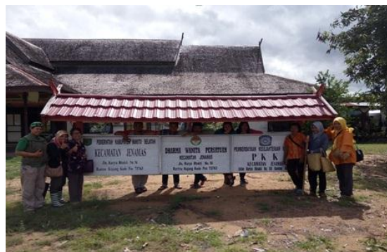
Gambar 2. Kegiatan Pelatihan Kerajinan Purun

Kegiatan kerajinan purun menjadi satu bagian dari kegiatan revitalisasi sebagai suatu rantai ekonomi baru yang bisa dikembangkan di kawasan disamping ikan dan lebah madu. Antusiasme masyarakat dalam mengikuti pelatihan ini sangat menggembirakan baik laki-laki maupun perempuan sangat bersemangat mengikuti pelatihan ini seperti terlihat pada Gambar 2 berikut :