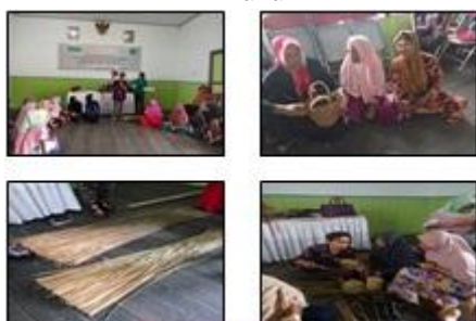
Gambar 3. Aktivitas Pelatihan Kerajinan Purun

Hasil yang diperoleh bahwa masyarakat memperoleh gagasan baru untuk beralih mata pencaharian dengan kegiatan ekonomi yang lebih ramah lingkungan dan tidak merusak alam. Masyarakat yang sebelumnya hanya bisa merusak alam, setelah dilakukan sosialisasi dan pelatihan menjadi lebih produktif. Pasar produk masyarakat juga telah ditemukan sehingga kegiatan ini bisa berkelanjutan. Hasil kegiatan sosialisasi dan