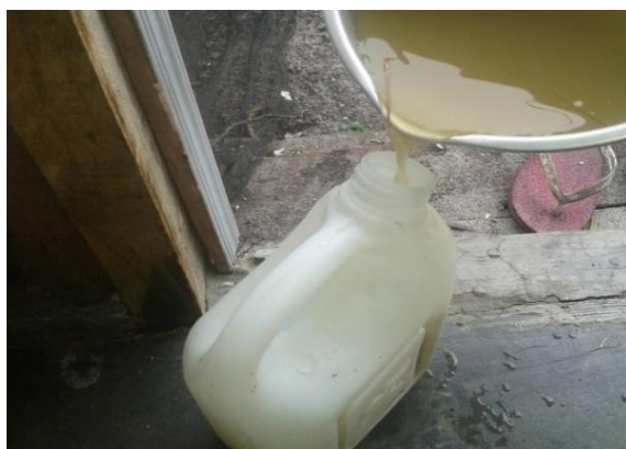
Gambar 1. Ekstrak serai wangi selesai diproses yang dituang dimasukkan ke dalam jerigen

Berdasarkan hasil percobaan beberapa konsentrasi ekstrak serai wangi mulai 25 ml, 50 ml dan 75 ml dan dicampur air bersih 100 ml untuk pengendalian hama kutu daun coklat pada tanaman yang diberikan cabe selama 3 minggu, ternyata dengan konsentrasi ekstrak serai wangi 75 ml ditambah air bersih 100 ml (PO 3 ) dapat mengurangi hama kutu daun coklat lebih