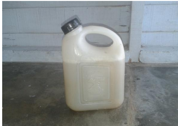
Gambar 2. Ekstrak serai wangi yang diinkubasi di jerigen siap disemprotkan sebagai pestisida organik