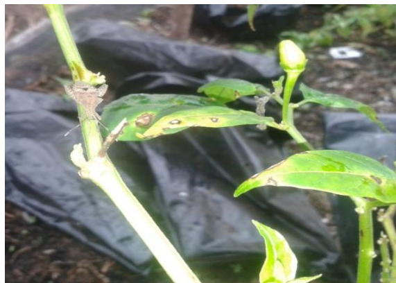
Gambar 7. Hama kutu daun coklat pada tanaman cabai