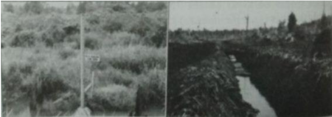
Gambar 1. Lahan gambut sebelum (kiri) dan setelah (kanan) direklamasi

Penyusutan volume yang irreversible menyebabkan hilangnya daya mengikat air serta meningkatkan sensitivitas terhadap erosi.