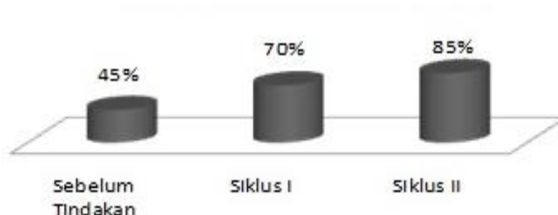
Gambar 2. Persentase Siswa yang Mencapai KKM

Untuk lebih jelasnya peningkatan yang terjadi dapat dilihat pada gambar 2 di bawah ini.