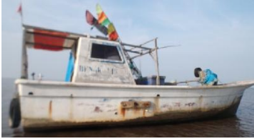
Gambar 2 Kapal Nelayan 3GT Berbahan Fibreglass