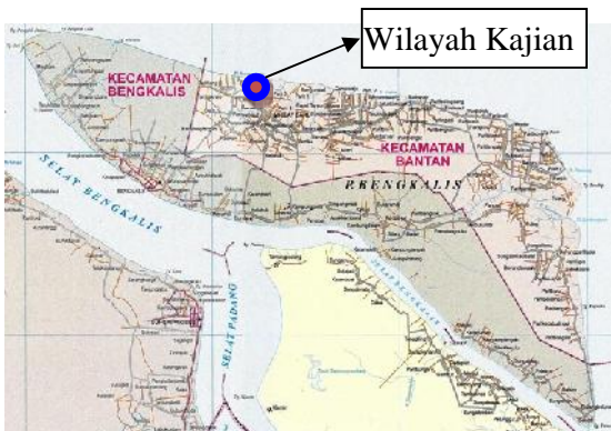
Gambar 4 Peta Pulau Bengkalis

Pada penelitian ini wilayah survey yang dijadikan sampel adalah desa Deluk kecamatan bantan kabupaten Bengkalis. Desa deluk merupakan desa yang mayoritas penduduknya berprofesi sebagai nelayan, selain itu desa tersebut berhadapan langsung dengan selat malaka. Gambar 4 merupakan tempat wilayah kajian ini dilakukan.