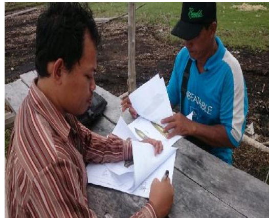
Gambar 9 Penandatanganan bentuk desain kapal plastic

Adapun gambar desain yang dihasilkan adalah gambar lines plan dan gambar general Arrangement pada gambar 10 dan gambar 11.