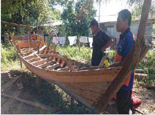
Gambar 7 Model kapal kayu yang ingin dijadikan model kapal plastic

kapal fiberglass -nya dapat dilihat pada Gambar 6, sedangkan gambar model kapal kayu dapat dilihat pada gambar 7.