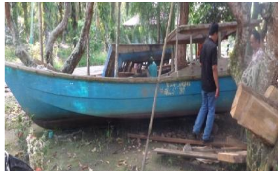
Gambar 6 Model kapal fiberglass yang ingin dijadikan model kapal plastik

Masyarakat nelayan di perairan selat malaka, khususnya masyarakat desa deluk dan kelompok nelayan Setia Budi menginginkan desain kapal plastiknya memiliki kesamaan bentuk dengan kapal fiberglass dan kapal kayu yang dimilikinya.