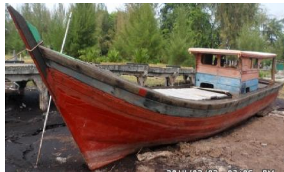
Gambar 1 Kapal Nelayan 3 GT Berbahan Kayu