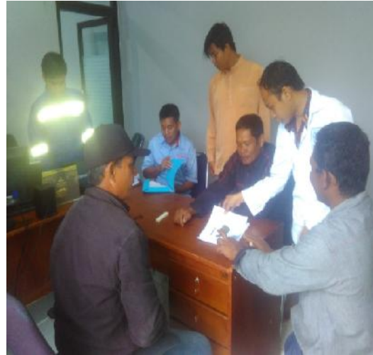
Gambar 8 Diskusi bentuk design kapal plastic

Bentuk dan ukuran dirancang berdasarkan diskusi dengan pengguna yaitu nelayan wilayah selat Melaka. Bukti diskusi antara peneliti dengan pengguna ditunjukkan pada gambar 8 dan gambar 9.