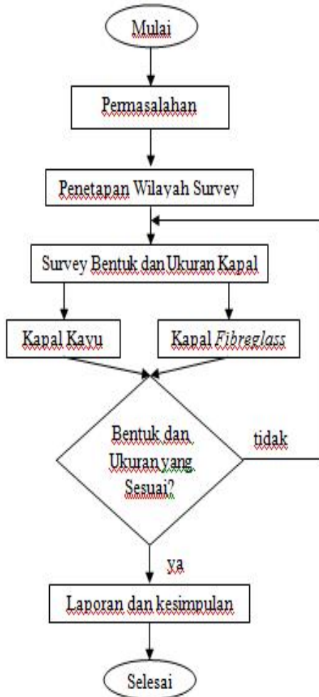
Gambar 3 Flow Chart Penelitian