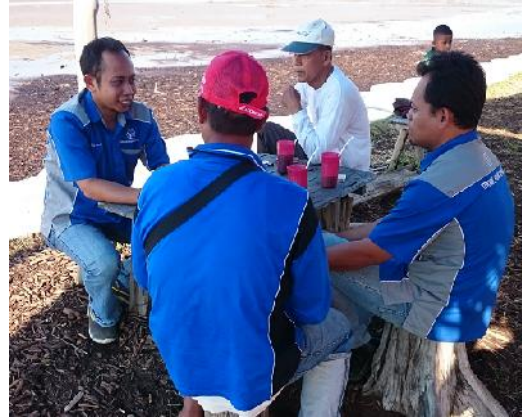
Gambar 5 Diskusi antara dosen dan kelompok nelayan

Kelompok Nelayan “Setia Budi” merupakan salah satu kelompok nelayan yang ada di desa Deluk kecamatan bantan wilayah pesisir selat melaka yang menginginkan perubahan kapal nelayan dengan bahan dasar plastik. Mereka berupaya membangun kerjasama dengan dosen teknik perkapalan untuk proses pembuatan kapal nelayan tersebut