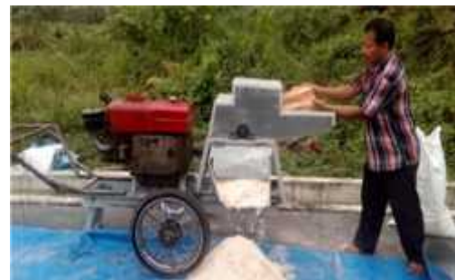
Gambar 5. Ujicoba dan analisa efektivitas alat

Ujicoba alat pamarut batang sagu dilakukan untuk memastikan alat bekerja dengan baik dan menganalisa efektivitas alat yang ditunjukkan pada Gambar 5.