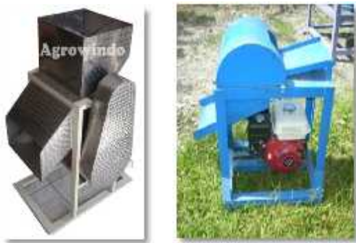
Gambar 2. Alat pamarut sagu

Alat pamarut sagu adalah alat yang digunakan untuk memarut batang sagu untuk proses lanjut. Alat pamarut sagu sudah banyak dijual di pasaran, tetapi alat pamarut sagu tersebut tidak memiliki konstruksi khusus yang bisa memproses pamarutan langsung di tempat pembelian batang sagu dan alat pamarut sagu tersebut harus memiliki tempat tersendiri. Begitu juga alat yang dibuat oleh Aceng Kurniawan pada penelitian dengan judul “Pengembangan Agroindustri Pengolahan Sagu Di Provinsi Papua Untuk Mendukung Ketahanan dan Disversifikasi Pangan” juga memiliki konstruksi yang tidak bisa berpindah tempat yang ditunjukkan pada Gambar 2.