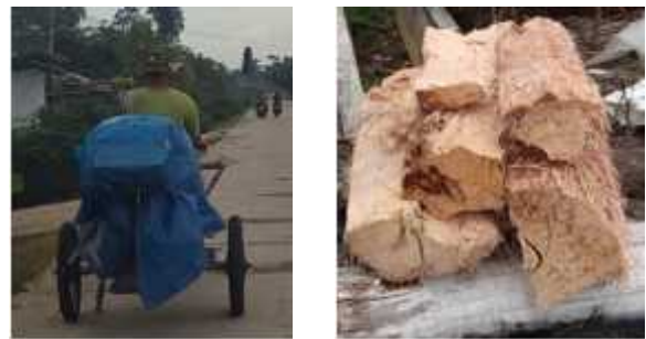
Gambar 6. Alat pamarut batang sagu portable yang di tarik oleh sepeda motor ke lokasi penjual batang sagu dan kondisi batang sagu yang dijual

Alat pamarut batang sagu dibawa dari rumah atau tempat usaha “Mie Sagu Barokah” dengan cara ditarik menggunakan sepeda motor dengan jarak 3 km. Kondisi alat pamarut batang sagu ketika di tarik oleh sepeda motor ke lokasi penjual adalah baik yang ditunjukkan pada Gambar 6.