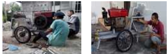
Gambar 4. Proses perakitan alat pamarut

Perakitan dilakukan setelah chasis di cat, rumah pamarut dan motor penggerak telah siap yang ditunjukkan pada Gambar 4.