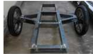
Gambar 3. Pembuatan chasis alat pamarut

Pembuatan chasis meliputi pekerjaan pengukuran, pemotongan, pengelasan dan penggerindaan. Proses pembuatan chasis di tunjukkan pada Gambar 3.