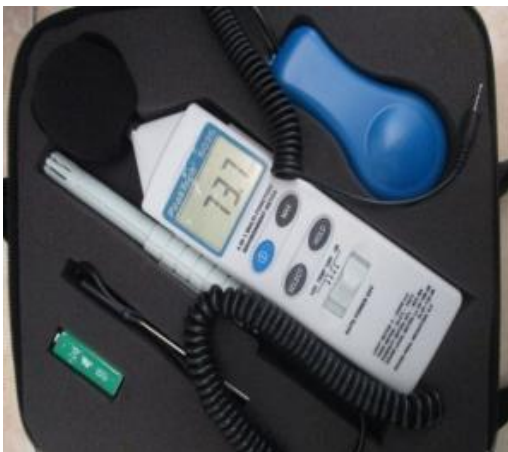
Gambar 2. 4 in 1 Multi Function Environment Meter

Sementara itu alat yang digunakan dalam penelitian ini adalah 4 in 1 Multi Function Environment Meter . Fungsi alat ini antara lain sebagai Lux Meter untuk mengukur cahaya, Termometer untuk mengukur suhu dengan rentang 20^0-75^0C , Humidity meter untuk mengukur kelembaban, dan Sound Level Meter untuk mengukur kebisingan. Alat ini cukup praktis dan mudah dalam penggunaannya karena cukup memasang bagian-bagian fungsi alat yang diperlukan dan mengalih fungsi alat dengan menggeser tombol yang tersedia. Alat ini cukup sensitif dengan keadaan, jadi jika ada perubahan keadaan seperti suhu meningkat maka hasil bacaan pun akan mengalami peningkatan. Alat ini digunakan karena penelitian ini terintegrasi dengan kegiatan penelitian indikator kenyamanan lainnya seperti kebisingan, pencahayaan dan kelembaban.