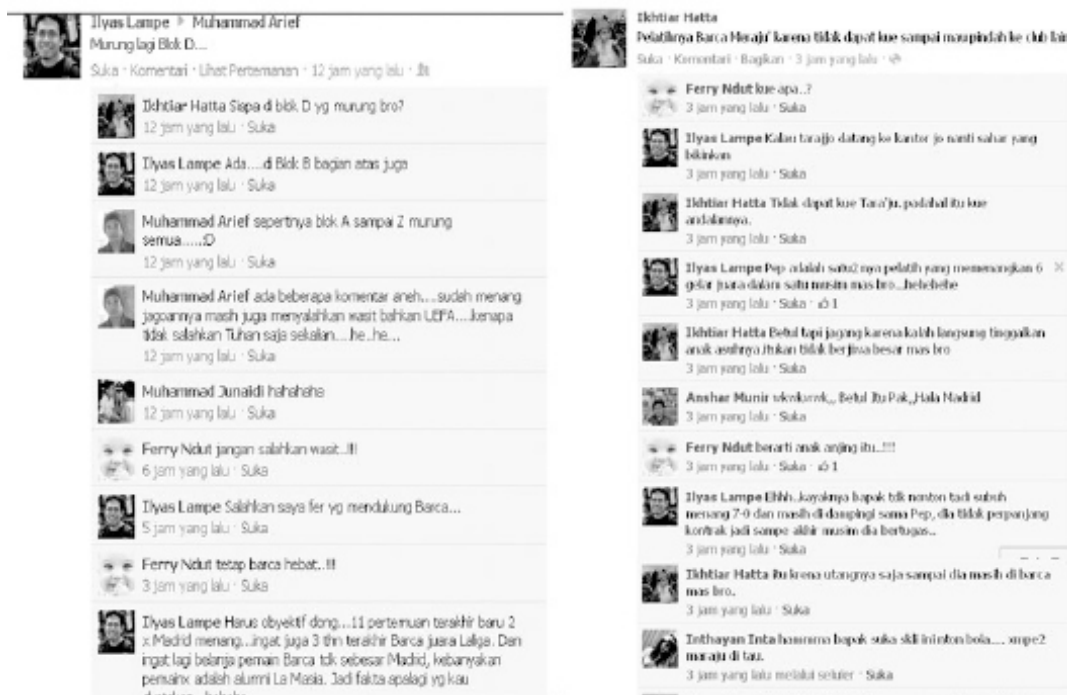
Gambar 2. Bentuk ekspresi dari pendukung dalam sebuah diskusi

cita namun ekspresi tersebut tidak cukup sehingga ekspresi-ekspresi tertawa yang menunjukkan rasa senang lainnya dimunculkan dengan cara menulis hahahahaha atau wkwkwkwkw. Ekspresi tertawa yang kurang bahagia ditunjukkan dengan tulisan hehehehe. Ekspresi-ekspresi tersebut menjadi salah satu cara menunjukkan relasi, teman, lawan, kalah ataupun menang. Ekspresi tersebut disatukan dengan alasan-alasan yang terangkum dalam sebuah diskusi (Gambar 2).