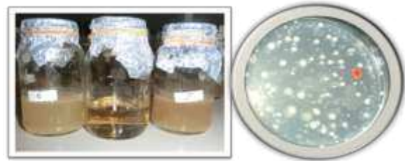
Gambar 2. Konsorsium mikrob pada media cair dan padat a = Mikrob filosfer dan mikrob rizosfer pada media cair, b = Mikrob filosfer pada media nutrisi agar (NA)

Kultivasi mikrob dari sampel daun dan tanah, diperoleh 144 konsorsium mikrob filosfer dan 48 konsorsium mikrob rizosfer. Kultivasi konsorsium mikrob pada media cair dan padat disajikan pada Gambar 2.