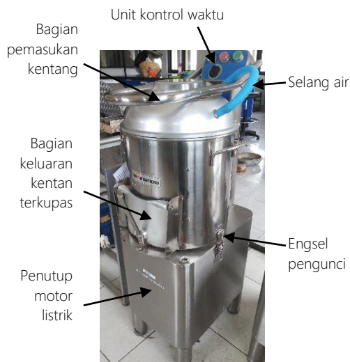
Gambar 1. Mesin pencuci dan pengupas kentang

Mesin pengupas dan pencuci kentang yang diuji merupakan mesin buatan RRC dengan model HLP-15. Mesin memiliki dimensi panjang 640 mm, lebar 520 mm dan tinggi 1120 mm. Konstruksi mesin terbuat dari stainless steel yang digerakkan dengan motor listrik 1 HP tegangan 220 V/50 hz. Terdapat unit kontrol yang mengatur waktu pengupasan. Konstruksi mesin secara keseluruhan dapat dilihat pada Gambar 1.