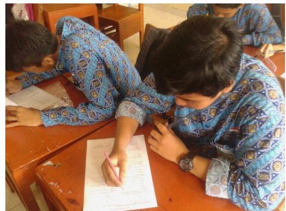
Gambar 3: Pemberian materi dan latihan soal

Hasil dari pertemuan pertama sampai terakhir diperoleh temuan yaitu masih banyak siswa kelas X yang masih rendah dalam penguasaan matematika dasar, dan ternyata dengan diadakannya kegiatan matrikulasi membuat mereka semangat mempelajari matematika dasar. Temuan lain, siswa terlihat antusias karena materi matematika dasar ini sangat mudah namun sebelumnya mereka belum kuasai. Pengabdian, mencoba mengkonfirmasi hasil kegiatan tersebut dengan melakukan postest dengan tujuan untuk mengetahui sejauh mana efek dari kegiatan matrikulasi dari sisi pemahaman matematika dasar. Hasil postest disajikan dalam tabel di bawah ini.