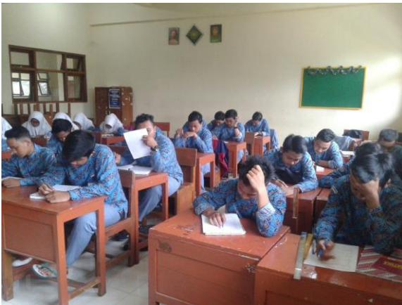
Gambar 2: Pemberian pretes

Pelaksanaan pemberian materi matematika dasar pada kegiatan matrikulasi dilaksanakan sebanyak 4 kali dalam sebulan, waktunya setelah pulang sekolah selama 1,5 jam per sesi. Pada peretemuan pertama materinya adalah operasi mengenai bilangan bulat, pembahasan mengenai operasi bilangan bulat sangat penting untuk menunjang kemampuan dasar matematika. Pertemuan kedua mengenai operasi bilangan pecahan, siswa SMA Muhammadiyah 3 Yogyakarta memiliki latar belakang kemampuan yang sangat variatif sehingga masih banyak dijumpai siswa kelas X yang belum lancar dalam operasi bilangan pecahan baik penjumlahan, pengurangan, pembagian maupun perkalian. Pertemuan ketiga mengenai operasi bilangan desimal dilengkapi dengan perubahan bilangan dari pecahan ke desimal atau sebaliknya. Pertemuan terakhir mengenai pangkat dan akar di sisipi materi fungsi.