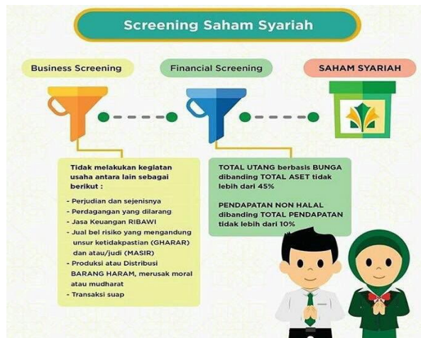
Gambar 2. Proses screening saham syariah