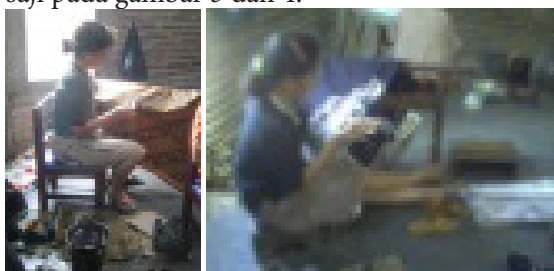
Gambar 3. Posisi Pembatik Memakai dingklik

Gambaran sikap duduk pembatik pada saat memakai dingklik dan kursi ergonomis tersaji pada gambar 3 dan 4.