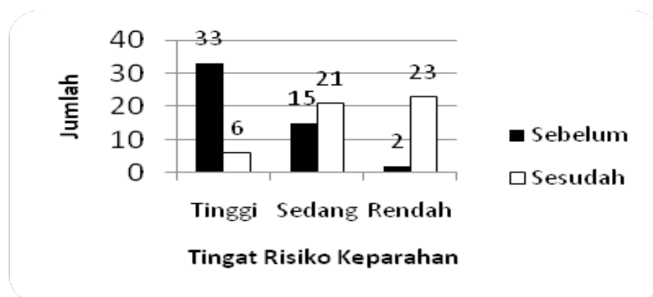
Gambar 4. Tingkat Keperahan Gangguan Muskuloskeletal