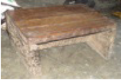
Gambar 1. Kursi "Dingklik"