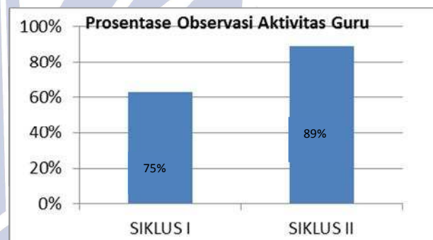
Diagram 1 Persentase Observasi Guru Siklus I dan II

Setelah dilakukan rekapitulasi dan analisis terhadap hasil observasi guru dari kedua pengamat, hasilnya menunjukkan bahwa dari siklus satu ke siklus berikutnya terdapat peningkatan persentase dan skor pencapaian kegiatan pembelajaran. Berikut ini disajikan data dalam bentuk diagram batang mengenai persentase aktivitas guru baik siklus I maupun siklus II.