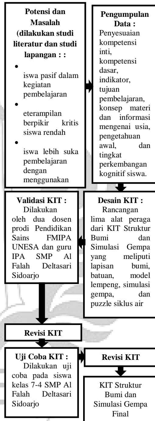
Gambar 1. Modifikasi Langkah-Langkah Penelitian dan Pengembangan

Sasaran penelitian ini adalah KIT struktur bumi dan simulasi gempa sebagai media pembelajaran untuk meningkatkan keterampilan berpikir kritis siswa kelas VII di SMP Al Falah Deltasari Sidoarjo yang diujicobakan pada 15 siswa. Instrumen penelitian yang digunakan untuk mengukur kelayakan dari aspek kevalidan berupa lembar telaah dan lembar validasi dengan teknik telaah dan validasi; kepraktisan berupa lembar pengamatan aktivitas guru, aktivitas siswa dengan teknik observasi, dan respon siswa dengan teknik angket; keefektifan berupa lembar evaluasi keterampilan berpikir kritis siswa dengan teknik tes yang dianalisis secara deskriptif kuantitatif.