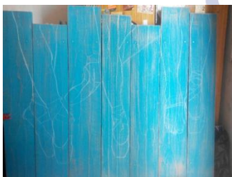
Gambar 8 Sketsa Desain pada Papan Kayu

Desain yang berupa gambar atau foto digital kemudian dipindahkan ke papan kayu menjadi sketsa terlebih dahulu.