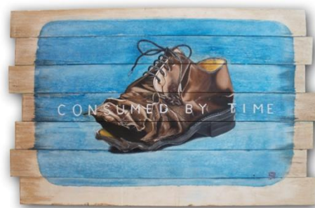
Gambar 12 Consumed By Time