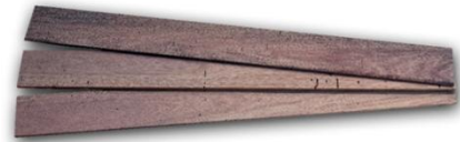
Gambar 5 Papan Kayu

Papan kayu yang penulis hadirkan merupakan dengan permukaan rata dan halus, halus yang dimaksud bukan licin tapi cocok untuk cat akrilik agar mudah menempel dengan sempurna.