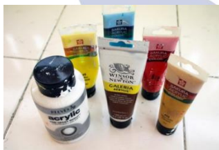
Gambar 3 Cat Akrilik

Cat akrilik merupakan salah satu bahan melukis yang memiliki sifat cepat kering. Penulis menggunakan bahan cat akrilik karena sifat catnya yang mudah kering dan mudah melekat pada medium kayu.