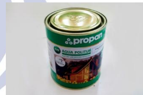
Gambar 6 Pernis Kayu

Pernis Kayu adalah bahan finishing untuk kayu yang bisa digunakan untuk melapisi kayu.