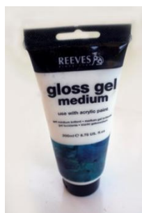
Gambar 4 Gloss Gel Medium

Gloss gel medium merupakan medium yang digunakan untuk campuran cat akrilik agar tidak terjadi penurunan warna saat kering. Medium gel ini pelukis gunakan untuk memindahkan gambar atau tulisan pada kertas hasil foto copy ke permukaan kayu.