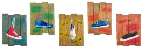
Gambar 11 Lonely

Judul : Lonely Media : Akrilik di atas Papan Kayu Ukuran : 48 cm x 38 cm x 5 panel Tahun : 2017