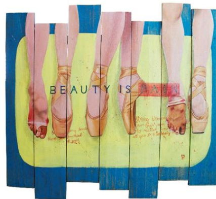
Gambar 10 Beauty Is Pain

Judul : Beauty Is Pain Media : Akrilik di atas Papan Kayu Ukuran : 108 cm x 98 cm Tahun : 2016