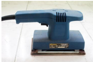
Gambar 2 Mesin Amplas

Amplas (kertas pasir) merupakan sejenis kertas yang digunakan untuk membuat permukaan benda-benda menjadi lebih halus dengan cara menggosokkan salah satu permukaan amplas yang telah ditambahkan bahan yang kasar kepada permukaan benda tersebut. Mesin amplas digunakan untuk mempermudah penulis untuk menghaluskan permukaan kayu agar permukaan kayu menjadi halus dan memudahkan penulis untuk berkarya.