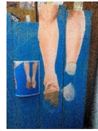
Gambar 9 Proses Pewarnaan Objek

Setelah selesai membuat sketsa pada papan kayu lalu mulai diwarnai satu-persatu objek berurutan dari warna yang paling dasar hingga detail objek yang digambar. setelah itu pemberian penekanan cahaya dan pendetailan pada setiap objek.