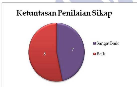
Gambar 1. Grafik Ketuntasan Penilaian Sikap

Efektivitas dinilai berdasarkan hasil keluaran penggunaan produk pengembangan (Nieveen, 2007). Dalam penelitian ini kit praktikum dinyatakan layak berdasarkan aspek efektivitas ditinjau dari hasil belajar siswa. Hasil belajar dinilai melalui tiga aspek yaitu sikap, pengetahuan, dan keterampilan selama proses pembelajaran berlangsung. Adapun hasil belajar siswa berdasarkan aspek sikap dan pengetahuan disajikan pada grafik berikut ini: