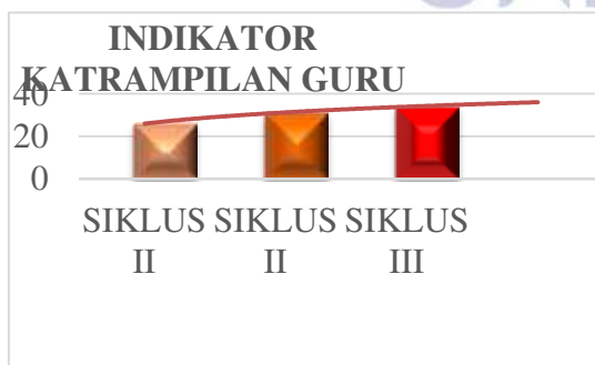
Indikator Katrampilan Guru Siklus I, Siklus II, lan Siklus III

Adhedhasar anane undhak-undhakan katrampilan guru sajrone pasinaon nyemak crita wayang. Bab iki dibuktikake menawa sajrone siklus I