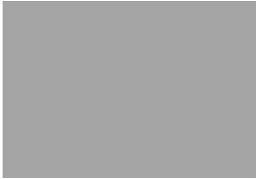
Gambar 1. Desain Screen Printing