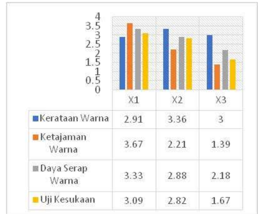
Gambar 3. Rata-rata Hasil Perwarnaan

Terdapat tiga sampel X1 artinya proporsi (1:4); X2 artinya proporsi (2:3); X3 artinya proporsi (3:2). Hasil uji rata-rata penilaian meliputi kerataan warna, ketajaman warna, daya serap warna, dan kesukaan. Hasil uji rata-rata dapat dilihat pada gambar 2.