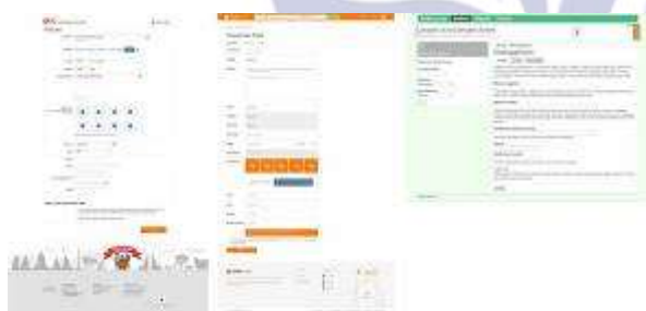
Gambar 2 halaman pasang iklan olx.co.id, jualo.com dan bekas.com

Perbandingan layout halaman pasang iklan olx.co.id, Jualo.com dan Bekas.com.