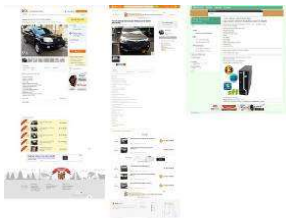
Gambar 4 halaman produk olx.co.id, jualo.com dan bekas.com

Perbandingan layout halaman produk olx.co.id, Jualo.com dan Bekas.com.