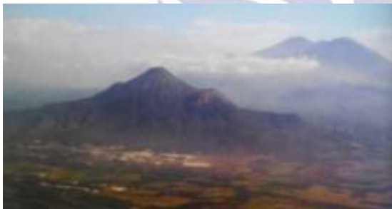
Gambar 1 Gunung Pawitra

Berikut merupakan gambar Gunung Pawitra yang dilihat dari pesawat menuju bandara Juanda di Surabaya. Didepannya terlihat aliran sungai porong, dan dibelakang tampak kedua puncak gunung Arjuna (kiri) dan gunung Welirang (gambar 1.1)