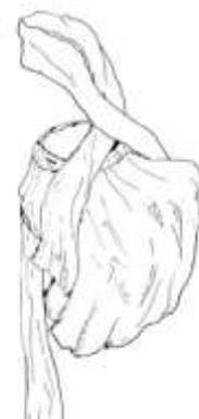
Gambar 9 desain karya 2 Hafidz R.S, 2016