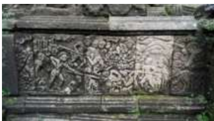
Gambar 3 Situs relief candi kerajaan