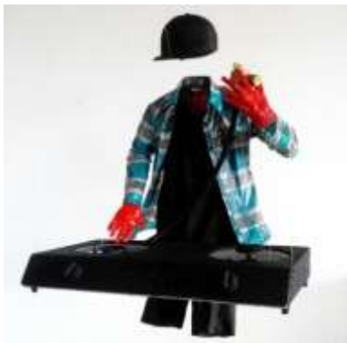
Gambar 6 karya Hafidz R.S berjudul “Sosial Boom”