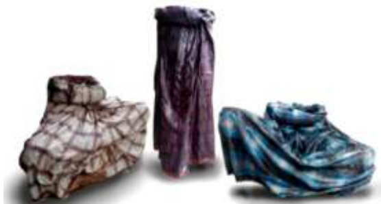
Gambar 7 karya Hafidz R.S, berjudul “Bukan wong Cingkrang” Dok. Hafidz R.S, 2015