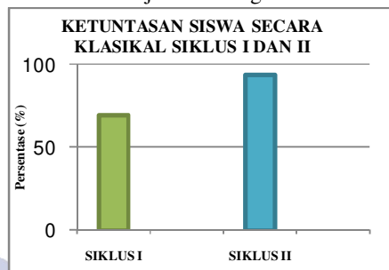
Diagram 3 Ketuntasan Siswa secara Klasikal Siklus I dan II

Kemudian peningkatan ketuntasan hasil belajar siswa pada siklus I dan II tersaji dalam diagram berikut :