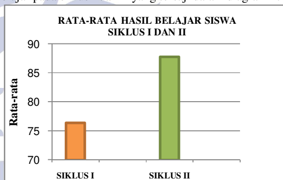
Diagram 4 Rata-rata Hasil Belajar Siswa Siklus I dan II

Selain itu juga terjadi peningkatan rata-rata hasil belajar pada siklus I dan II yang tersaji dalam diagram 4: