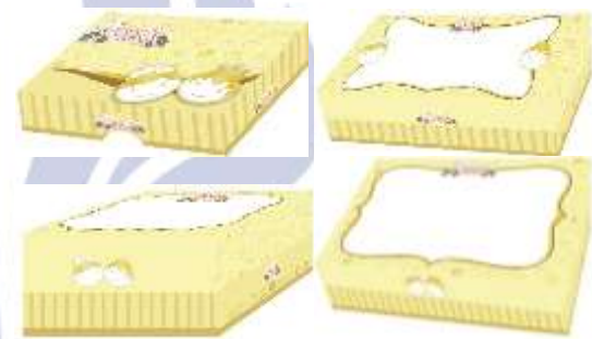
Gambar 6. Desain 2 Kemasan Andik Bakery

Pada kemasan desain 1 dibuat untuk merepresentasikan kesan tradisional yang elegan, desain menggunakan pattern ornamen sebagai background untuk memberi kesan tradisional. Dengan nuansa warna merah maroon dan gold untuk memberikan kesan elegan dan eksklusif. Dan icon pengantin Jawa untuk memberikan kesan tradisional Jawa.