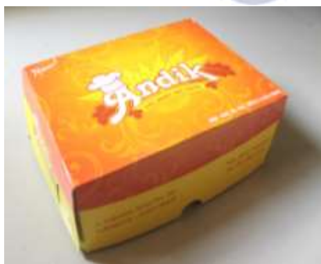
Gambar 2. Kemasan Isi 2 Roti baru Andik Bakery

Memiliki kemasan pertama kali dengan desain dan logo Andik untuk kemasan berisi 2 – 3 roti. Dengan sedikit perubahan pada logo yaitu topi chef yang awalnya berada ditengah logo di ubah menjadi pada huruf A yang dianatomikan sebagai manusia dengan pose tangan dan topi chef sebagai lambang kepala. Pada kemasan ini logo menggunakan border tags persegi panjang. Background pada kemasan bermotif garis berwarna merah maroon dan merah cerah.