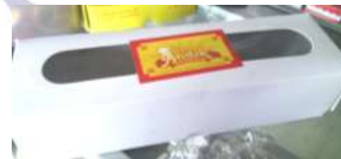
Gambar 4. Kemasan Kue Roll Bakery

Sedangkan untuk kemasan lainnya Andik Bakery menggunakan kemasan jadi yang diberi sticker logo Andik Bakery. Biasa digunakan untuk kue buaya, kue kura-kura, dan kue tradisional sebagai seserahan.