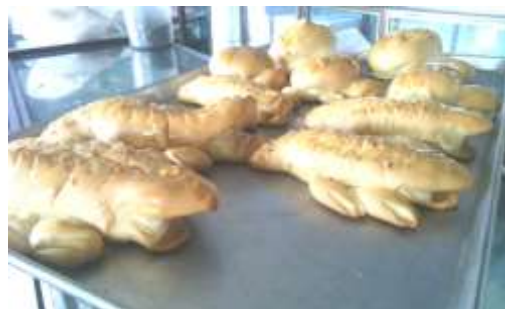
Gambar 3. Roti Buaya Andik Bakery

sisi atas. Di pojok kiri atas kemasan terdapat violator untuk menandakan kemasan baru. Terdapat logo di sisi kanan dan kiri. Terdapat keterangan alamat dan nomor telepon yang tercantum pada bagian depan kemasan.