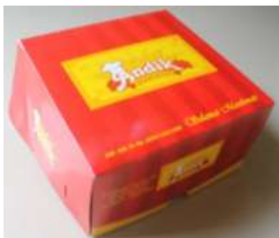
Gambar 1. Kemasan Isi 2 Roti Pertama Andik Bakery

Analisis data yang dilakukan memproses data yang terkumpul kemudian dianalisis bersama dengan pengumpulan data existing dan kompetitor