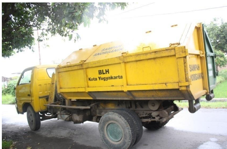
Gambar 2. pembuangan limbah padat menggunakan mobil angkut yang dilakukan oleh Badan Lingkungan Hidup Kota Yogyakarta

Limbah padat non-medis Rumah Sakit Jogja dibuang di TPAS Piyungan, bekerjasama dengan BLH Yogyakarta. Proses pengangkutan dilakukan dengan menggunakan truck tertutup dan telah terjadi pemisahan antara sampah organik dan anorganik sehingga meminimalkan risiko potensial terhadap masyarakat dan lingkungan di daerah pemukiman. Proses pembuangan adalah open dumping dengan frekuensi pengangkutan dua kali seminggu, namun terkadang satu minggu satu kali pengangkutan.