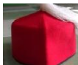
Gambar 13. Topi Turki