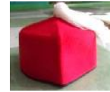
Gambar 4. Topi turki