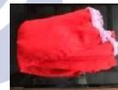
Gambar 5. Selendang (sampur)