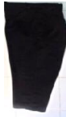
Gambar 12. Celana