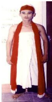
Gambar 1. Busana Besutan Pakem