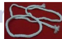
Gambar 6. Topi turki