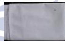
Gambar 11. Bebet