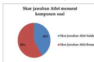
Diagram 1.6 Skor jawaban atlet menurut komponen soal

soal yang salah sebesar 151 dari jawaban soal yang benar sebesar 209 dan dari pengetahuan pelatih menurut komponen dari jawaban soal yang salah sebesar 60 dari jawaban yang benar sebesar 100.