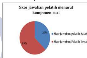
Diagram 1.7 Skor jawaban pelatih menurut komponen soal