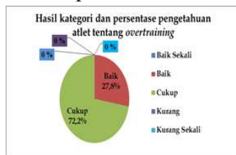
Diagram 1.2 Kategori dan persentase pengetahuan atlet tentang overtraining

Berdasarkan pada tabel 1.2 diketahui bahwa rata-rata nilai pengetahuan atlet klub atletik Petrogres Kabupaten Gresik sebesar 55,6 termasuk dalam kategori "cukup".