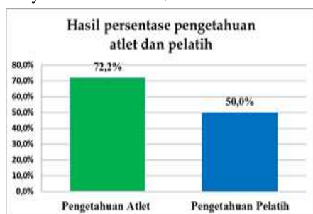
Diagram 1.5 Presentase pengetahuan atlet dan pelatih

Berdasarkan hasil dari diagram 1.4 rata-rata pengetahuan atlet dan pelatih yang paling tinggi yaitu pengetahuan pelatih sebesar 71,3 dan paling terendah yaitu sebesar 54,6.