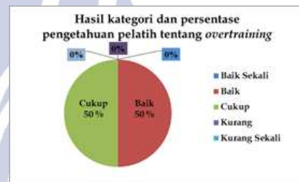
Diagram 1.3 Kategori dan presentase pengetahuan pelatih tentang overtraining

Berdasarkan tabel 1.3 diketahui bahwa rata-rata nilai pengetahuan pelatih klub atletik Petrogres Kabupaten Gresik sebesar 71,3 termasuk dalam kategori "baik".