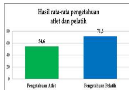
Diagram 1.4 Rata-rata pengetahuan atlet dan pelatih