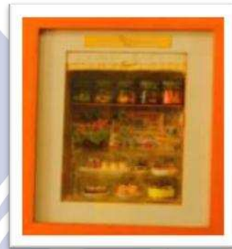
Prinsip rupa karya Toko kue

Bentuk karya Monica secara keseluruhan memperhatikan prinsip rupa dasar dalam menata, mengkomposisikan, mengatur, menyusun, menciptakan variasi dalam karyanya. Karena pada sebuah karya seni prinsip rupa harus digunakan dalam mewujudkan karya seni yang bermutu.