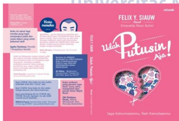
Gambar 1 Cover Buku Udah Putusin Aja!

Analisis desain buku Udah Putusin Aja! menggunakan analisis konsep teoritis, yaitu mengacu pada teori desain komunikasi visul. Pada analisis formal buku Udah Putusin Aja! berfungsi sebagai sarana untuk membantu menyampaikan informasi agar lebih dipahami dan lebih menarik. Sebagaimana fungsi buku merupakan sarana untuk menyampaikan informasi secara tercetak. Citra yang dibangun oleh unsur-unsur desain di setiap konten yang di sampaikan, sehingga pembaca tidak bosan dan merasa ditemani saat membaca. Apalagi buku ini target pembacanya adalah pemuda pada era digital ini. selain untuk menyampaikan informasi harapanya buku ini juga mampu mempengaruhi pembaca dengan citra yang dibangun oleh unsur-unsur desain.