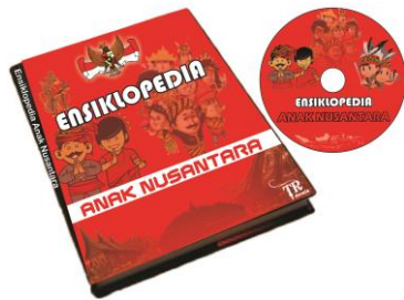
Gambar 1. Buku dan CD Edukasi Ensiklopedia Anak Nusantara.

Ensiklopedia Anak Nusantara ini merupakan sebuah inovasi baru dalam memperkenalkan budaya bangsa Indonesia anak-anak dini, sehingga nantinya dengan mudah mereka memahami budaya masing-masing. Ensiklopedia Anak Nusantara berupa buku edukasi yang berisi cerita-cerita anak nusantara mengenai budaya lokal di daerahnya yang kemudian dilengkapi dengan gambar ilustrasi sesuai dengan budaya yang dibahas pada kegiatan outbound learning . Sehingga dengan mudah memahami, selain itu mampu dengan cepat dan tepat dipraktekkan.