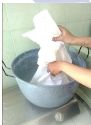
Gambar 1 : mordanting