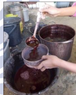
Gambar 2 : ekstrak buah cengkeh