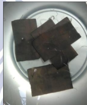
Gambar 4: Fiksasi