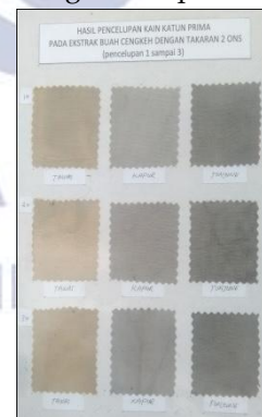
Hasil Pencelupan Kain Katun Prima Dengan komposisi 1