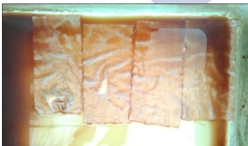
Gambar 3: Pencelupan Kain

kapur tohor dilarutkan dengan 1 l air),. Tunjung (70 gram dilarutkan dengan 1 l air air). Setiap larutan didiamkan semalam dan cairan beningnya yang digunakan. Fiksasi pada penelitian ini hanya dilakukan 1x, karena hasil dari fiksasi 1x atau 2x adalah sama.