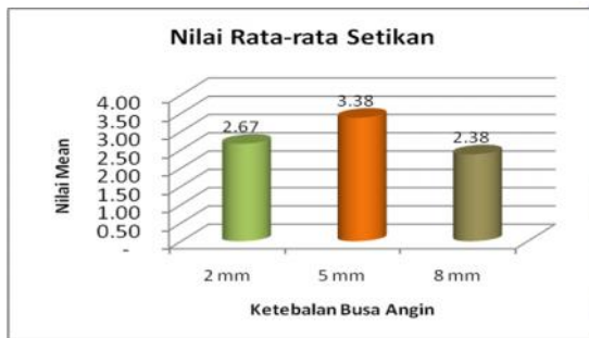
Gambar 3. Diagram batang 5 setikan

Untuk mengetahui aspek setikan yang baik dari ketiga ketebalan busa angin yang digunakan dapat dilihat dari diagram dibawah :