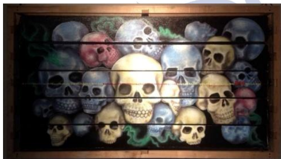
Gambar 5.5 Dyan Condro, secret #3, akrilik, pensil diatas kanvas 85x128 cm tahun : 2014

Secret #3 ini sama seperti cerita dalam karya sebelumnya dengan menampilkan tiga gambar dalam satu bingkai. Dan gambar pertama menampilkan sosok wajah Michael Jackson saat terkenal, dan gambar ke dua menampilkan perubahan wajah Jackson dari sebelum sampai selesai operasi plastik. Dan yang terakhir menampilkan banyak tengkorak yang menceritakan ketika mati Jackson sudah tidak jelas bentuk tengkoraknya karena efek dari beberapa operasi yang dijalaniannya.