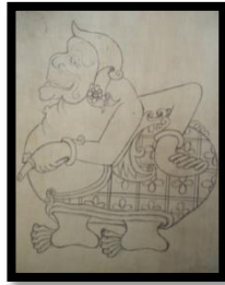
Gambar 1 Sketsa Gambar Semar

dicampur dengan air diberi lem kayu merk Rajawali secukupnya.