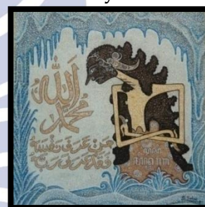
Gambar 10 "Resi Minta Raga"

Judul Karya : Resi Minta Raga Ukuran : 80 x 80 cm Tahun Pembuatan : 2012 Tekhnik : Kolase ( kulit telur )