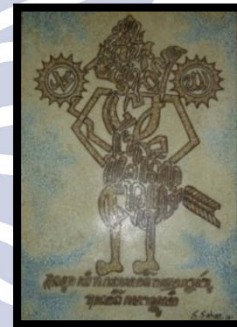
Gambar 8 “Prabu Krisna Huruf Jawa”

Judul Karya : Prabu Krisna Huruf Jawa Ukuran : 60 x 50 cm Tahun Pembuatan : 2012 Tekhnik : Kolase ( kulit telur )