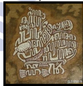
Gambar 6 “Semar huruf Jawa”

Judul : Semar Huruf Jawa Ukuran : 40 x 50 cm Tahun Pembuatan : 2013 Teknik : Kolase (kulit telur, serbuk kayu)