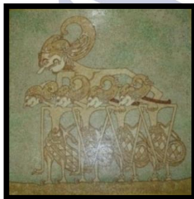
Gambar 7 “Pandhawa Lima” Dok. Yohana, 2014

Judul Karya : Pandhawa Lima Ukuran : 80 x 80 cm Tahun Pembuatan : 2011 Tekhnik : Kolase ( kulit telur )