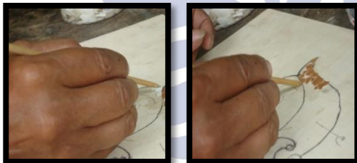
Gambar 2 Tekhnik Kolase Dengan Kulit Telur Pada Gambar Semar