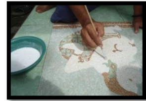
Gambar 3 Proses Pelapisan Menggunakan Bahan Kalsium

dicampur dengan air diberi lem kayu merk Rajawali secukupnya.