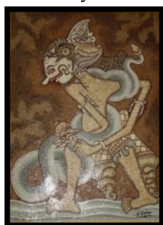
Gambar 9 "Bima suci"

Judul Karya : Bima Suci Ukuran : 60 x 80 cm Tahun Pembuatan : 2012 Tekhnik : Kolase ( kulit telur dan serbuk kayu )