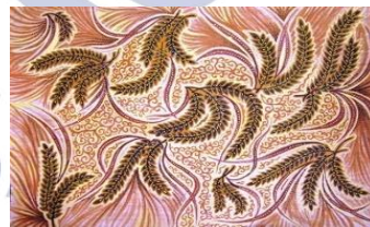
Gambar 7 motif Pari Sumilak

“Bathik Jonegoroan” sing nduweni motif sekar jati iki mujudake gegambarane kahanan alam Bojonegoro. Ana kurang luwih 44,05% wilayah Bojonegoro kawangun saka alas negara, alas kasebut ana ing sisih kidul. Alas iki dadi wates antarane Kabupaten Bojonegoro klawan kabupaten-kabupaten liyane kayata, Kabupaten Nganjuk lan Kabupaten Madiun.