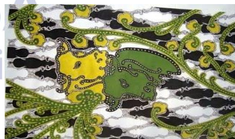
Gambar 5 motif Parang Lembu Sekar Rinambat

Adhedhasar andharan kasebut bisa dimangerteni yen isih ana dhaerah yaiku. Kecamatan Kanor minangka sawijine dhaerah sentra wayang thengul ing Kabupaten Bojonegoro, ing kecamatan kasebut isih nyimpen lan asring ngananakake pagelaran wayang thengul. Saperangan dhalang uga isih asring nampilake wayang thengul, saperlu narik kawigatene generasi enom supaya ngugemi lan nerusake perjuwangane kanggo njaga budaya.