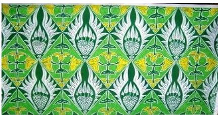
Gambar 2 motif Mliwis Mukti

Motif Mliwis Mukti minangka sawijine motif “Bathik Jonegoroan” sing nggambarake budaya sing diduweni Bojonegoro. Motif iki nggambarake manuk mliwis lan tetuwuhan. Sakliyane iku motif iki duweni motif sing paling beda klawan motif-motif liya, sing mbedakake yaiku wujud wajik sing ana ing sajrone motif. Wajik kasebut dadi pemisahak antarane manuk mliwis lan tetuwuhan.