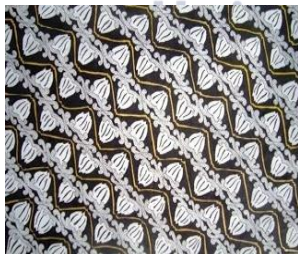
Gambar 9 motif Parang Dahana Mungal

“Motif Parang Dahana Mungal iki dadi sawijine motif sing disenengi karo kanca-kanca (pengrajin). Jarene paling nggamapang lan ora pati ruwet anggone nggamabar motif,....” (Martini, 27 Juli 2013)