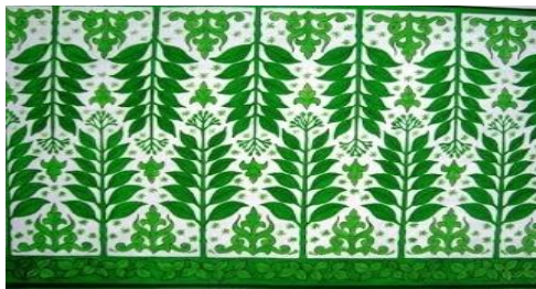
Gambar 8 motif Sata Ganda Wangi

“Motif Sata Ganda Wangi iki awale nduweni mung rong werna yaiku ijo lan putih. Ijo ing kene nggambarake wit mbako lan paesan-paesane liya sing ana ing sakiwa tengene mbako. Werna dhasar nggunakake werna putih. (Martini, 27 Juli 2013).