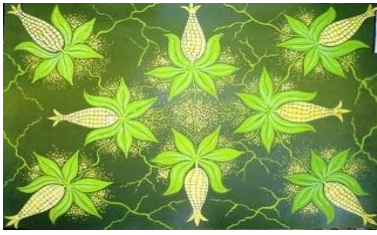
Gambar 1 motif Jagung Miji Emas

makna sing ana ing motif iki,.....”(Martini, 27 Juli 13)