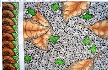
Gambar 6 motif Sekar Jati

Motif Parang Lembu Sekar Rinambat iki nggambarake kahanan peternakan sapi ing Bojonegoro. Saben taun anane peningkatan jumlah peternak sapi ing Kabupaten Bojonegoro. Adhedhasar data saka Badan Pusat Statistik nuduhake yen Kabupaten Bojonegoro nduweni potensi dadi prodhusen daging sapi nasional. Data saka BPS sing nyathet produksi daging sapi wiwit saka taun 2009 nganti 2011 saya suwe saya dhuwur kacathet wiwit 3.386 nganti 4.738 kasebut nuduhake yen populasi sapi ing Bojonegoro luwih saka cukup. Mula saka iku motif Parang Lembu Sekar Rinambat didadekake salah sawijining motif “Bathik Jonegoroan”.