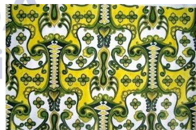
Gambar 3 motif Gatra Rinonce

Mula saka kuwi nganti saiki jeneng kasebut isih dieling dening masyarakat lan kanggo njaga supaya jeneng kasebut tetep ana ing satengah-tengahing masyarakat, mula didadekake jeneng sawijine papan wisata lan didadekake sawijine motif “Bathik Jonegoroan” supaya carita-carita kasebut ora cures lan tetep dieling dening generasi enom saiki.