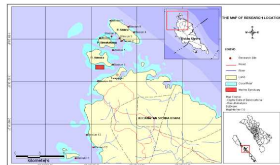
Gambar 1. Peta lokasi penelitian di Desa Tuapejat

Sebagian wilayahnya merupakan pulau-pulau kecil, yaitu: P. Siburu (576,9 ha), P. Simakakang (199,6 ha), P. Pitotogat/Hawera (392,3 ha), P. Siteut (14,64 ha), P. Pitojat Sabeu (74,55 ha), P. Pitojat Goisok (12.25 ha) dan pulau karang yang lebih dikenal dengan P. Hantu ( Gambar 1 ).