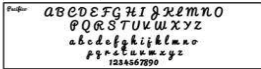
Typeface “Pacifico” yang Terpilih Sebagai caption

konsep ini mengarah kepada suasana menyenangkan, nyaman dan kehangatan keluarga dalam menikmati wisata yang ada di Sedati. Pemilihan jenis typeface pada logo dan caption berdasarkan pertimbangan bahwa huruf sans serif memberikan kesan nyaman, tenang dan santai (Rustan, 2011: 108).