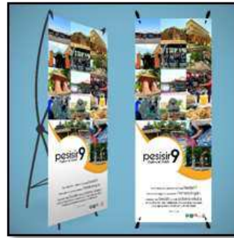
Desain X banner

Pada desain x-banner menggunakan foto-foto wisata yang dibahas dibuku wisata Sedati, warna oranye juga digunakan pada x-banner karena warna oranye dapat memberikan kesan menyenangkan, semangat dan kehangatan warna oranye juga bisa menggambarkan konsep delight yang berarti menyenangkan.