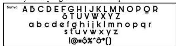
Typeface “Bunya” yang Terpilih Sebagai Logotype

Untuk pemilihan typeface yang diaplikasikan pada beberapa media nantinya didasarkan pada sebuah pertimbangan kesesuaian jenis typeface dengan konsep yang ditentukan, kemudian pemilihan typeface ini dipengaruhi oleh faktor legibility . Proses dalam penentuan tipografi ini melalui konsultasi kepada dosen pembimbing dan hasil dari hasil konsultasi dosen pembimbing dan dari keyword yang telah dilakukan peneliti.