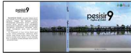
Desain Cover Depan dan Belakang