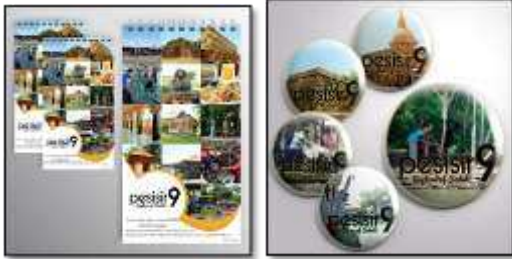
Desain Notebook dan Pin