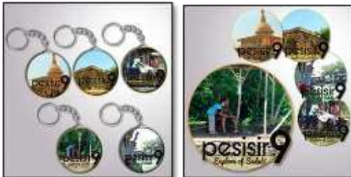
Desain Stiker dan Gantungan Kunci