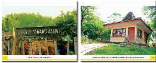
Desain Halaman isi buku kiri dan kanan

Pada halaman isi buku terdapat foto lokasi wisata, penjelasan tentang wisata, informasi tentang wisata dan barcode untuk menghubungkan ke google maps , layout pada isi buku menggunakan konsep delight dengan menggunakan warna hijau oranye dan kuning. Warna hijau dapat memberikan kesan segar, kesuburan dan kealamian, sedangkan warna oranye dapat memberikan kesan menyenangkan, semangat, keinginan dan kehangatan, dan warna kuning dapat menggambarkan keceriaan, kegembiraan, persahabatan dan kehidupan. Ketiga warna tersebut dapat menggambarkan kegembiraan dan keceriaan wisata yang dibahas dibuku wisata Sedati dan sangat cocok untuk menggambarkan konsep delight yang dimana mempunyai arti menyenangkan. Font yang digunakan pada layout isi buku wisata Sedati menggunakan 3 jenis font , pada nama lokasi wisata peneliti menggunakan font bunya sedangkan pada penjelasan tentang wisata dan penjelasan tentang info wisata menggunakan font arctic dimana kedua font tersebut termasuk jenis font sans serif yang dimana dapat memberikan kesan nyaman, tenang dan santai, sedangkan pada kalimat informasi peneliti menggunakan font pacifico yang mempunyai karakter santai dan nyaman. Layout yang digunakan pada halaman penjelasan dan informasi adalah jenis layout mondrian dimana foto disusun landscape dengan menggabungkan ke dua halaman dan mensejajarkan foto dengan teks, jenis layout ini memberikan kesan luas pada foto sehingga dapat mempengaruhi pembacanya menjadi tenang dan menyenangkan.