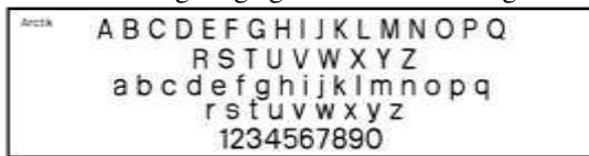
Typeface “Arctik” yang Terpilih Sebagai bodycopy

Sedangkan untuk pemilihan font dengan karakter sedikit melengkung adalah untuk memadupadankan font sans serif yang terlihat tegas dan kaku dengan font pacifico yang mempunyai karakter melengkung agar terlihat seimbang.