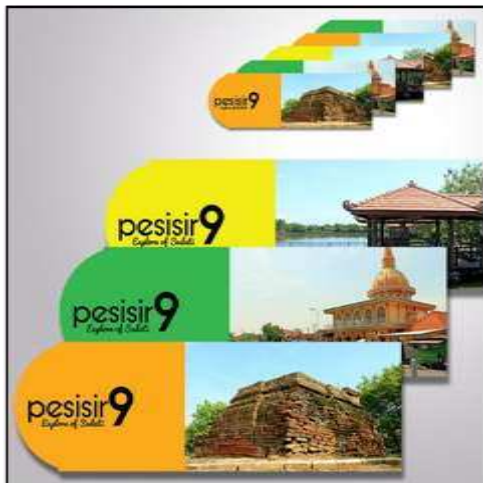
Desain Pembatas Buku

Pada desain stiker, gantungan kunci, pembatas buku dan pin menggunakan desain yang sama, menggunakan foto lokasi wisata dan menggunakan 3 warna yang mewakili konsep delight . Sedangkan pada notebook menggunakan konsep yang sama dengan x-banner dan poster yaitu dengan menyusun foto-foto wisata Sedati dan memberikan warna oranye yang dapat mewakili konsep delight .