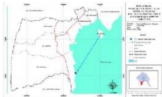
4.8 Peta Pemasaran Kerang Hijau

lempasing. Dari data yang ada dapat dilihat bahwa pemasaran yang dilakukan oleh nelayan kerang hijau di pulau pasaran adalah dengan cara menjual ke pelelangan ikan dengan jumlah 75 orang atau 97,40 %. Pemasaran kerang hijau merupakan pemasaran dengan jumlah besar, besarnya penjualan kerang hijau ke TPI (Tempat Pelelangan Ikan) dikarenakan banyaknya permintaan dari tempat pelelangan ikan, selain itu harga di tempat pelelangan ikan yang relatif stabil mengakibatkan banyak kepala keluarga nelayan kerang hijau di Pulau Pasaran menjual ke tempat pelelangan ikan. Walaupun tempat penjualan yang relatif jauh jika dilihat dari Pulau Pasaran.