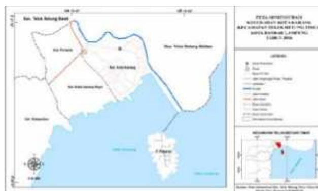
Gambar 4.2 Peta Kelurahan Kota Karang Kecamatan Teluk Betung Timur Kota Bandar Lampung Tahun 2016.