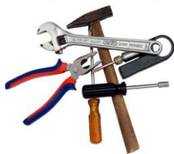
Gambar 1. Alat Perkakas Tangan

Perkakas tangan adalah alat bantu kerja yang digunakan untuk menyelesaikan suatu pekerjaan dengan sumber tenaga manual (tenaga manusia), tenaga listrik, tenaga angin, maupun tenaga minyak yang dalam pemakaiannya dapat dengan mudah di bawa berpindah tempat.