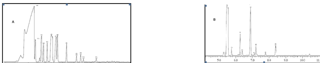
Gambar 1. Kromatogram dari alat KG-SM, dari sampel minyak terpentin hasil produksi perusahaan lokal (A) dan minyak terpentin perdagangan (B).