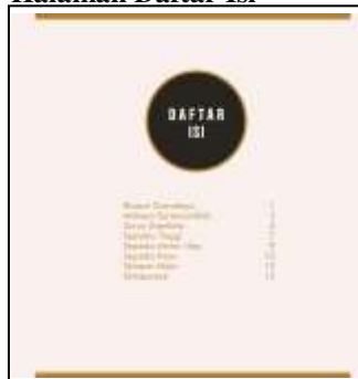
Desain Halaman Daftar Isi

Halaman hak cipta hingga daftar isi menggunakan background warna putih tulang agar jelas terbaca tentang isinya dan untuk memberi kesan simple namun terlihat unggul dengan frame warna emas.