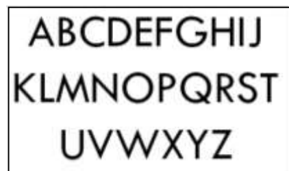
Font TW Cent MT ( Sumber : hasil olahan peneliti, 2016 )

Font yang digunakan pada cover buku fotografi yang akan dirancang.