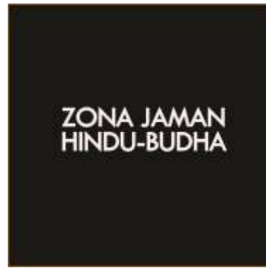
Halaman Pembatas Tiap Koleksi Unggulan

Berisi tentang profil Museum Negeri Mpu Tantular. Halaman ini digunakan agar pengunjung tahu akan informasi asal usul dari Museum Negeri Mpu Tantular itu sendiri sebelum mencari informasi tentang koleksi-koleksi yang ada di dalamnya.