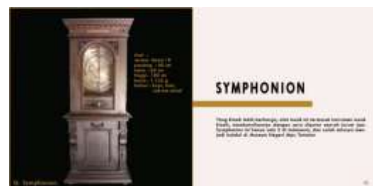
Halaman Isi Buku

Koleksi yang termasuk dalam zona koleksi von faber. Mencantumkan foto sekaligus penjelasan tentang informasi untuk