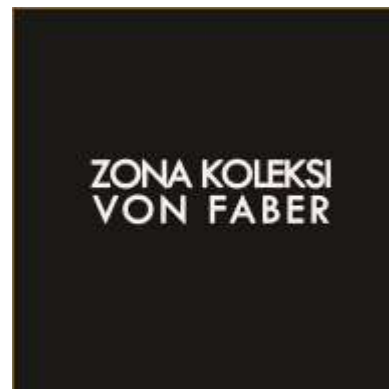
Halaman Pembatas Tiap Koleksi Unggulan

Foto koleksi yang termasuk dalam zona teknologi modern dan peraga iptek. Mencantumkan foto sekaligus penjelasan tentang informasi untuk koleksi unggulan. Telepon Meja yang berasal dari Surabaya ini merupakan telepon yang berbahan logam. Memiliki dua bagian, bagian pertama untuk berbicara dan bagian lainnya untuk mendengarkan. Telepon yang memiliki dimensi 46cm x 24 cm ini dibuat pada sekitar abad XVII M.