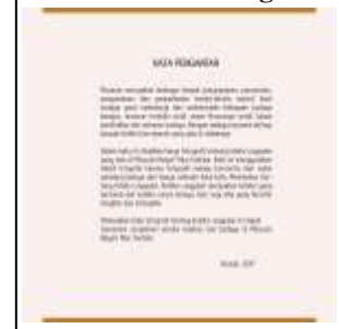
Desain Halaman Kata Pengantar