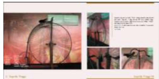
Halaman Isi Buku