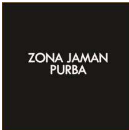
Halaman Pembatas Tiap Koleksi Unggulan

Menampilkan foto dengan layout yang sama yaitu menggunakan layout picture windows layout. Di halaman ini menjelaskan tentang koleksi unggulan yang ke dua yaitu patung Durga Mahesa Suramardhini beserta penjelasan tentang informasi koleksi tersebut. Durga ini merupakan patung durga yang memiliki estetika tinggi, hasil pahatannya sempurna dibanding dengan durga-durga lainnya. Dan juga durga terlengkap yang memiliki senjata, serta durga ini merupakan sepenggal cerita yang telah diulas melalui patung. Bisa disebut patung Durga Mahesa Suramardhini ini adalah patung durga yang sangat proposional. Mahesa Suramardhini ditemukan di Candi Jawi Prigen – Pasuruan.