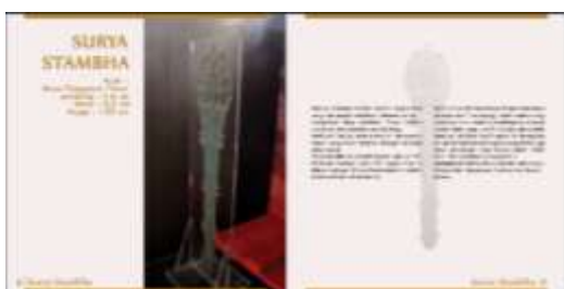
Halaman Isi Buku

Peneliti menampilkan foto koleksi unggulan yang masuk dalam zona jaman purba yaitu surya stambha beserta penjelasan yang menginformasikan tentang koleksi unggulan ini. Surya Stambha merupakan ragam hias yang menyerupai matahari, namun sebenarnya ini adalah kapak untuk lambang sosial. Ditemukan