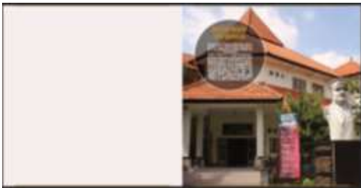
Halaman Profil Museum Negeri Mpu Tantular

Berisi tentang profil Museum Negeri Mpu Tantular. Halaman ini digunakan agar pengunjung tahu akan informasi asal usul dari Museum Negeri Mpu Tantular itu sendiri sebelum mencari informasi tentang koleksi-koleksi yang ada di dalamnya.