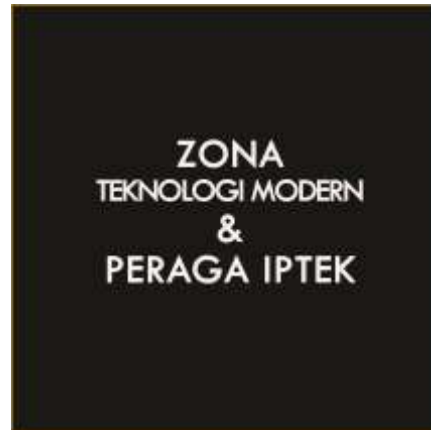
Halaman Pembatas Tiap Koleksi Unggulan

di Nusa Tenggara Timur, dan merupakan koleksi terbesar yang ada di Indonesia. Dengan demikian mengapa koleksi ini masuk dalam kategori koleksi unggulan. Di halaman ini menggunakan copy heavy layout yang lebih banyak / dominan pada naskah.