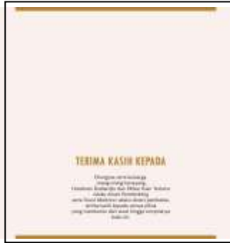
Desain Halaman Ucapan Terima Kasih