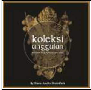
Desain Cover Depan Buku Fotografi

Desain cover yang akan ditampilkan memilih yang lebih sederhana dengan adanya ikon koleksi unggulan museum yang menjadi nomer 1 yaitu hiasan Garudeya, Garudeya sendiri merupakan koleksi yang paling di unggulkan di Museum Negeri Mpu Tantular yang telah ditemukan oleh seorang anak yang berasal dari Kediri. Cover d dibuat dengan sedemikian simple namun terlihat seperti sesuatu yang memiliki nilai lebih seperti keyword yang telah ditentukan.