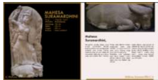
Halaman Isi Buku

menampilkan foto koleksi unggulan yang paling unggul yaitu hiasan Garudeya, dan juga informasi tentang Hiasan Garudeya tersebut, pengunjung dapat mengetahui informasi tentang hiasan garudeya dalam halaman ini. Penjelasan tentang asal, dimensi, siapa yang pertama kali menemukan dan juga penjelasan tentang bagian-bagian yang ada di hiasan Garudeya tersebut. Dalam halama ini layout yang digunakan adalah picture windows layout, terlihat pada foto yang sangat fokus ditengah dan jauh lebih besar dari pada penjelasannya.