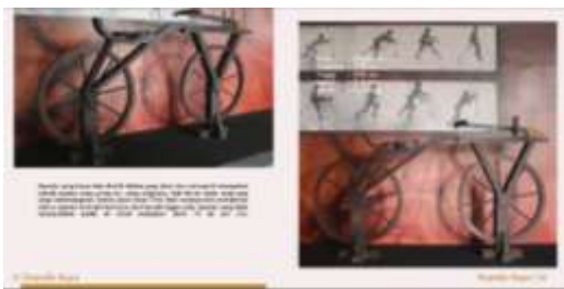
Halaman Isi Buku

Foto koleksi yang termasuk dalam zona teknologi modern dan peraga iptek. Mencantumkan foto sekaligus penjelasan tentang informasi untuk koleksi unggulan. Di halaman ini foto koleksi yang biasa disebut Sepeda Motor Uap, sepeda ini berasal dari Surabaya hasil sumbangan dari Museum Polisi Surabaya. Sepeda ini diproduksi di Jerman dengan produksi yang sangat terbatas.