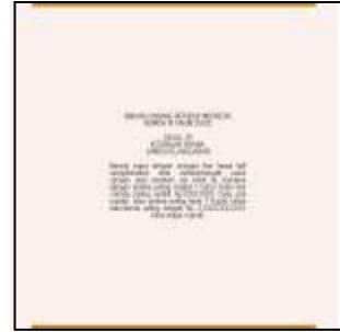
Desain Halaman Hak Cipta