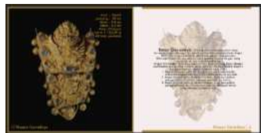
Halaman Isi Buku

menampilkan foto koleksi unggulan yang paling unggul yaitu hiasan Garudeya, dan juga informasi tentang Hiasan Garudeya tersebut, pengunjung dapat mengetahui informasi tentang hiasan garudeya dalam halaman ini. Penjelasan tentang asal, dimensi, siapa yang pertama kali menemukan dan juga penjelasan tentang bagian-bagian yang ada di hiasan Garudeya tersebut. Dalam halama ini layout yang digunakan adalah picture windows layout, terlihat pada foto yang sangat fokus ditengah dan jauh lebih besar dari pada penjelasannya.