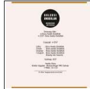
Desain Halaman Penerbit