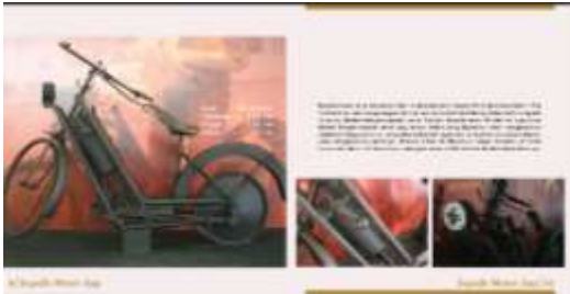
Halaman Isi Buku

Foto koleksi yang termasuk dalam zona teknologi modern dan peraga iptek. Mencantumkan foto sekaligus penjelasan tentang informasi untuk koleksi unggulan. Di halaman ini foto koleksi yang biasa disebut Sepeda Motor Uap, sepeda ini berasal dari Surabaya hasil sumbangan dari Museum Polisi Surabaya. Sepeda ini diproduksi di Jerman dengan produksi yang sangat terbatas.