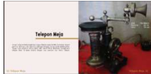
Halaman Isi Buku

Foto koleksi yang termasuk dalam zona teknologi modern dan peraga iptek. Mencantumkan foto sekaligus penjelasan tentang informasi untuk koleksi unggulan. Di halaman ini terdapat 2 foto tampak dari sisi belakang dan depan. Sepeda kayu ini semua material terbuat dari kayu, Sepeda yang berasal dari Surabaya ini dapat menempuh jarak 15 km per jam. Bentuk sepeda yang paling tua di Museum Negeri Mpu Tantular yaitu sepeda ini yang biasa disebut Sepeda Kayu.